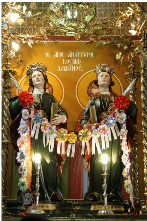
Nella foto: S.S. Cosma e Damiano Tek fotografia: Shënjtravet Kozmai dhe Damiani

shumë besimtarë dhe u mba tradita e vjetër e bekimit të kuclvet. Shumë muartin pjesë tek celebrimi i përgjimit natën, që mbaroi me dhënien e vajit të shenjtë të sëmuarve. Lutja e natës ndër ditët 26 dhe 27, e karakterizuar ka tradita e zakonshme e kalimit të natës së fundit mbë kishë, bën sa të mbijetojë një besim i lashtë, "riti i inkubacionit", që mund të përcaktohet si një proces, nëpërmjet të cilit kërkohet një zbulim hyjnor, një lënie e pjotë dhe me besim tek dashuria e mëshirshme të Shënjtravet, të cilët parkalesen për shërimin e kurmit dhe të shpirtit. Proçesioni i pasditës së 27 vjeshtës, gjatë udhëvet të katundit, me statujat e shenjtravet, i ka mbullitur celebrimet.