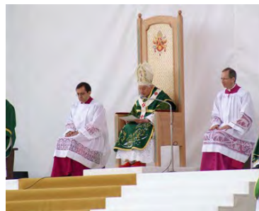
Nella foto: Papa Benedetto XVI Tek fotografija: Papë Benedetto XVI

mbullitur tek motoja që qe zgjedhur sa të rrëfjhet mirë kjo vizitë: "Në emrin e Zotit Krisht, Nazaretasi, kërcë!".