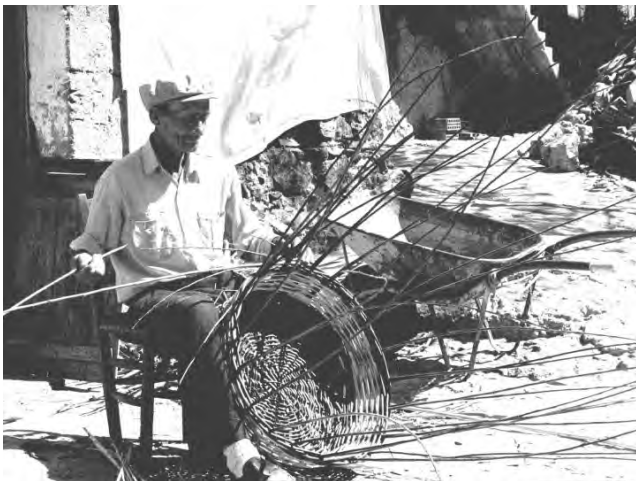
Santa Sofia d'Épiro - Shën Sofia