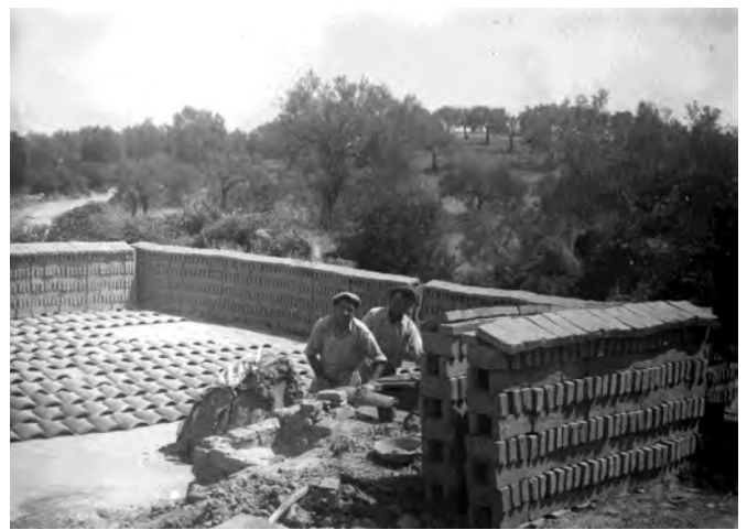
San Cosmo Albanese - Strigari