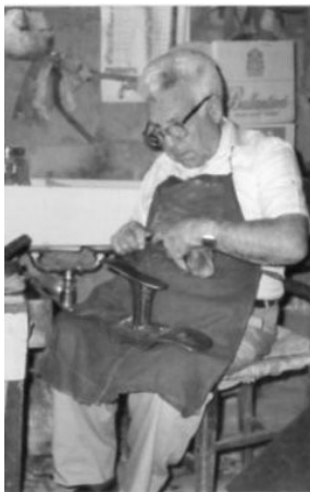
Macchia Albanese - Maqi