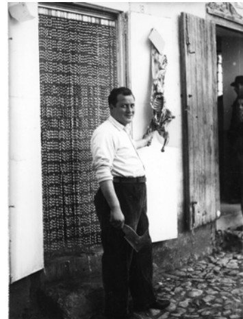
San Giorgio Albanese - Mëbzati