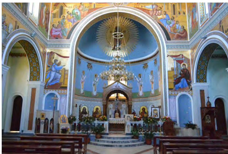
Nella foto: Interno della Chiesa Tek fotografia: Brenda Kishë

të të Fjëjturit të Shën Mërisë dhe te muri, ku është Pagëzoria, është afresku i Pagëzimit të Zotit Krisht.