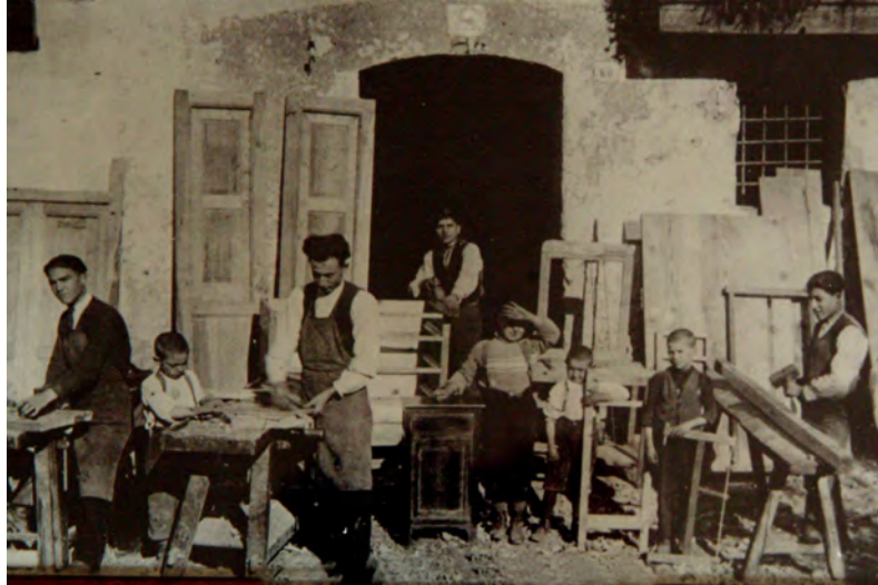
Vaccarizzo Albanese - Vaqarici