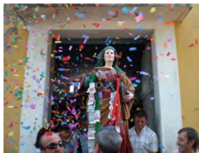
Nella foto: Santa Sofia Tek fotografia: Shën Sofia

gjindja; pra u bë shfaqja piroteknike, tue fërnuar me shfaqjen e grupit rock'n'roll/rockabilly "Twist Contest", që pat shumë sukses, kryesisht në mes të rinjesh. Të djelën 18, ditën e festës, u kremtua Liturgia Hyjnore, e vëzhduar ka procesioni gjatë udhëvet të katundit me Shënjen, të bashkuar ka Banda Muzikore "V. Bellini". Mbrëmja u nis me hapjen e qoshkevet enogastronomike dhe të gëzuar ka kabaren i komikut të Kosencës Paolo Marra dhe ka shfaqja muzikore e grupit të folk rock-it "Ankara", të përbërë ka Asesorati për Turizmin e Krabinës së Kalabrisë. Festimet u mbulltin me ditën e tetë e festës: të shtunë 24 u kremtua Lutja e Mbrëmjes dhe pra një lotari me çmime të ndryshme, dhe të djelë 25 u kremtua Liturgia Hyjnore dhe u rivendos Shënjtja mbrënda kamares së saj.